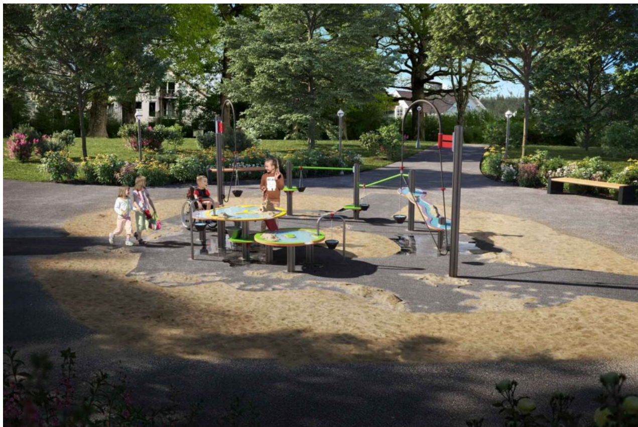
Transportrør og bord